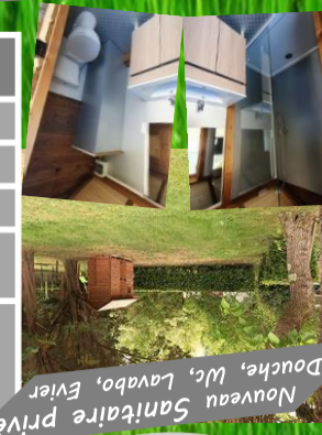
Nouveau Sanitaire privé Douche, Wc, Lavabo, Evier