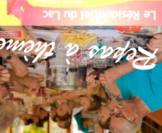
Repas à thème